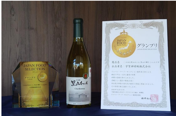
画像 かぬま里山わいん様 鹿沼市観光協会様

また、ワインだけでなくジュースやジェラートなども取り扱っているので、お酒が飲めない方もぜひ！