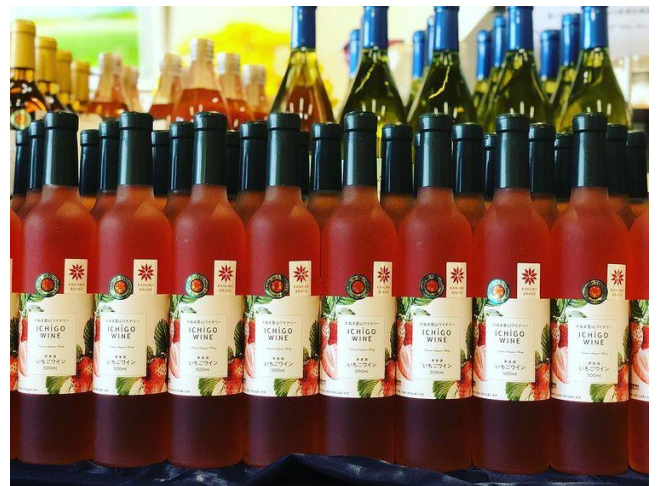
いちごの季節にはいちごワインも気になりますね～